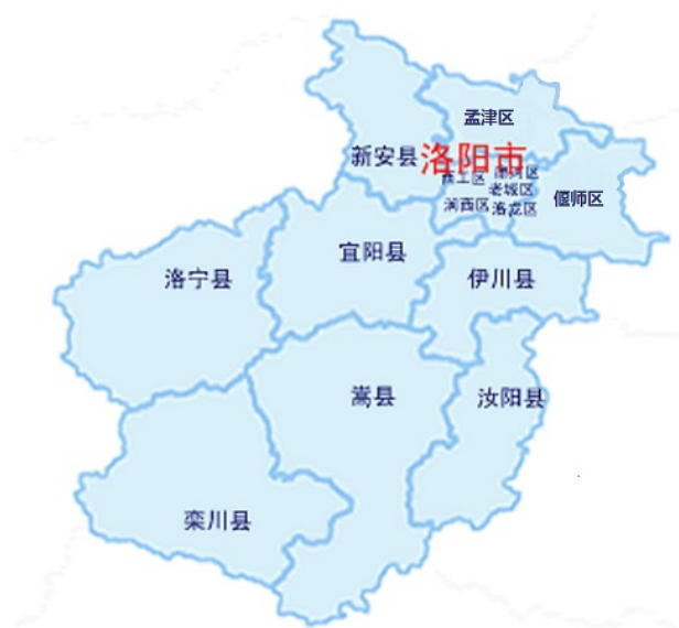
洛阳市行政区划示意图

文化旅游方面，洛阳是一座历史源远流长、文化底蕴深厚的千年古都。洛阳有5000多年文明史、4000多年城市史、1500多年建都史。现有全国重点文物保