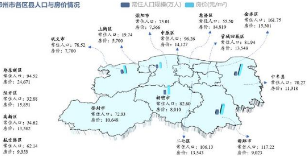
郑州市各区县人口与房价情况