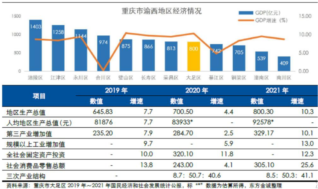
大足区主要经济指标情况（单位：亿元，%）

拥有双桥经开区、大足工业园区、大足高新技术开发区三个成熟工业集聚区。其中，双桥经开区作为中国重型汽车工业的“摇篮”，产业基础扎实，形成了以汽车及零部件、现代装备制造为支柱的产业体系；大足工业园区拥有中国西部最大、配套最全、辐射最强的五金市场群；大足高新技术开发区重点打造智能制造装备、环保装备和台湾智慧经济示范区三大产业基地，获批为市级智能制造装备产业基地。